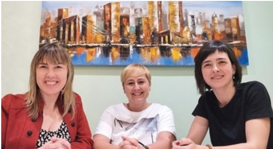
Donostiako bulegoko lantaldea.

hasieratik amaierara arte. Horrek esan nahi du bezeroekin elkarlanean aritzen garela ideiarekin sorreatik, negozioaren diseinua eta garapena barne hartuz, hazkunde eta zabalkundearen faseak kudeatuz, eta beharrezkoa izanez gero, itxiera edo birsorkuntza prozesuetan ere lagunduz. Proiektu bakoitzaren fase bakoitzean espezializatutako aholkularitza ematen dugu, ekonomia, finantza, lege eta antolaketa arloetan, gure bezeroei arrakasta lortzeko tresna eta ezagutza guztiak eskainiz. Honela, gure bezeroek lasaitasun osoz lan egin dezakete, jakinda profesional talde bat dutela atzean, enpresaren edo proiektuaren fase guztietan sostengua eta aholkularitza emango diena.