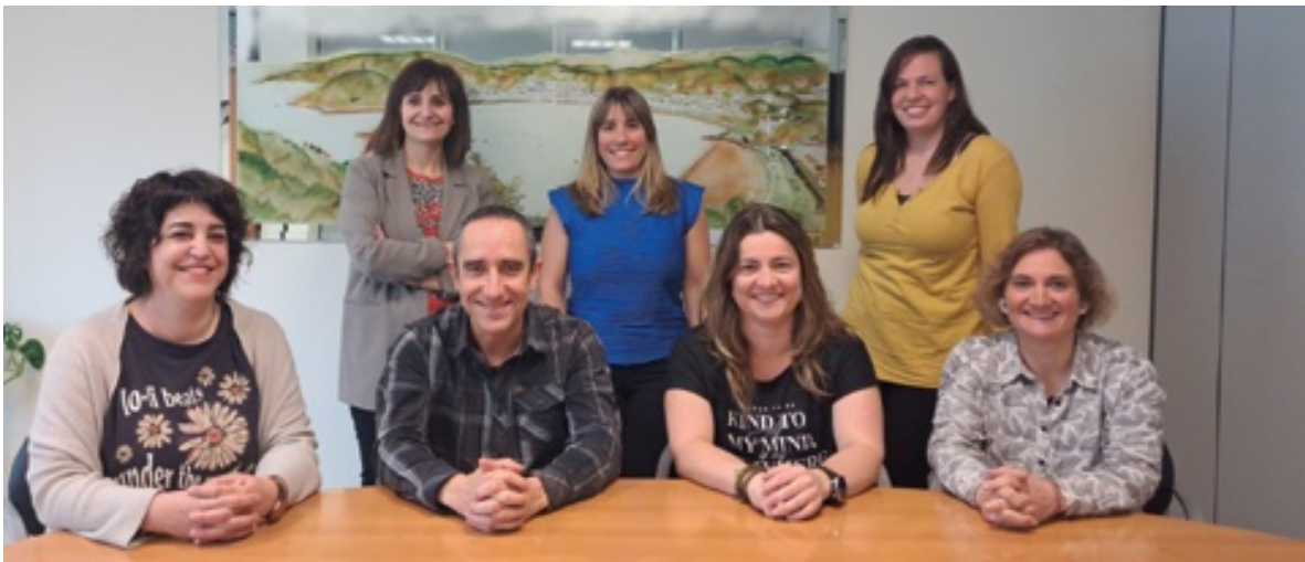
Leitzako bulegoko lantaldea.