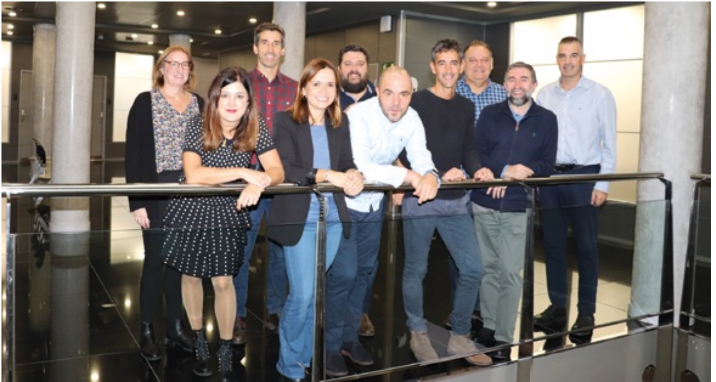
ULMA Taldeko Euskara batzordea.

ditugu: alemana, frantsesa, italiarra, ingelesa... Hizkuntzak kultura ere markatzen du neurri handi batean, eta hori guztia kudeatzea erronka handia da.